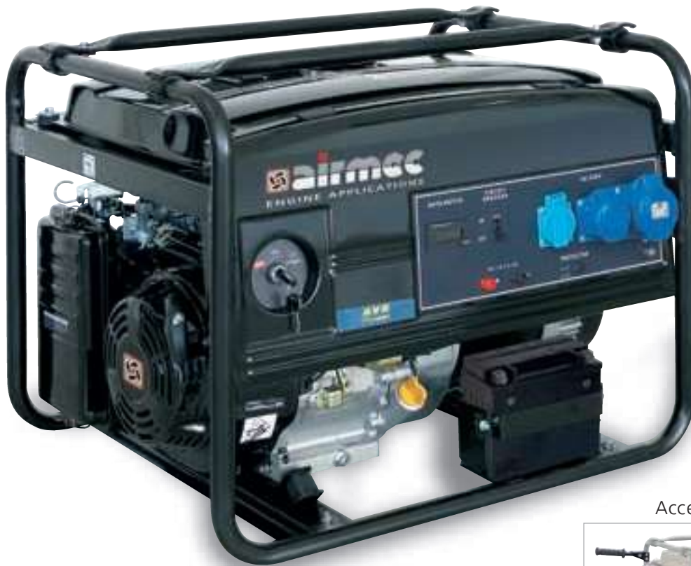
Accessorio - Accessory