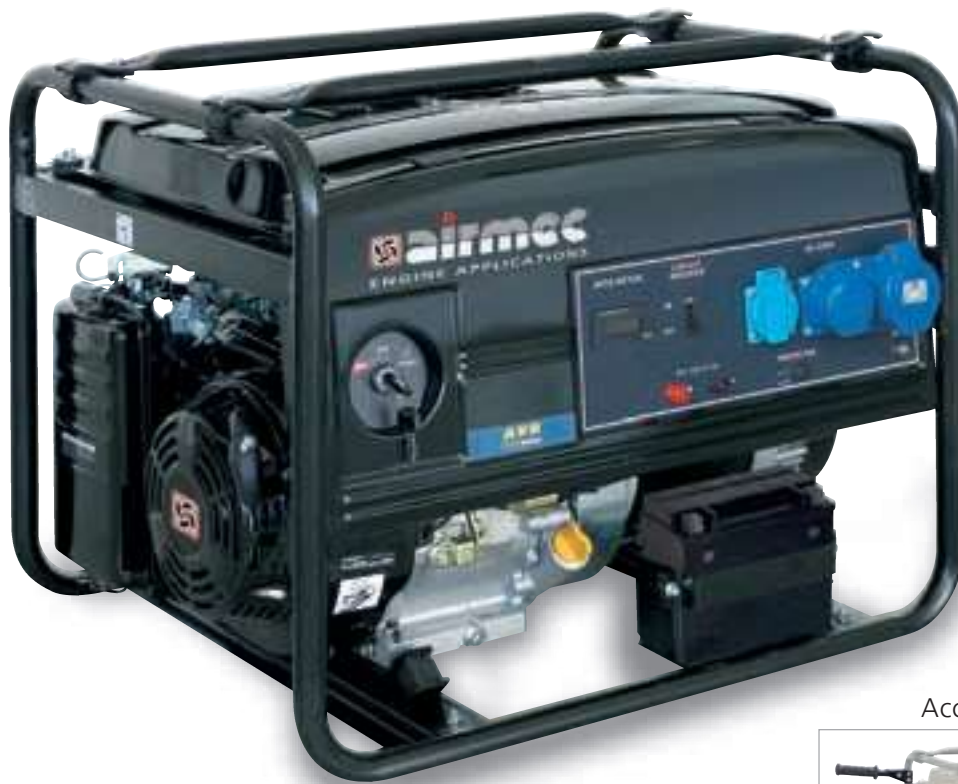
Accessorio - Accessory